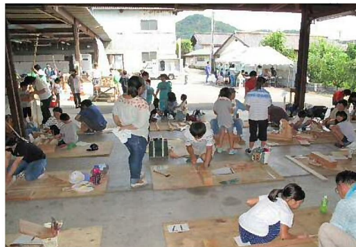
上は木工教室の様子

8月5日に木工教室を行いました。今年は天気が心配でしたが、結局快晴となりました。皆さん、一所懸命に作品を作られていました。例年よりも仕上がり早く、12時には全員の作品が完成しました。来年は今年以上のイベントにし、より多くの皆様に楽しんでいただきたいですね。午後は高崎祭りが行われ、主に工事部の人々が参加しました。暑さを吹き飛ばす感じで大いに盛り上がったようです。初めて参加した人も楽しかったようで、とても充実した1日を過ごしたのではないのでしょうか。