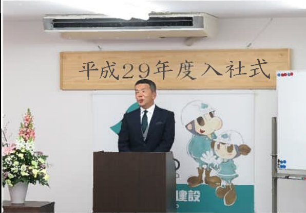
新入社員へ挨拶する社長

平成29年度入社式を無事に終えることができました。3名の新しい仲間を全員で1日も早く育てていきたいですね。