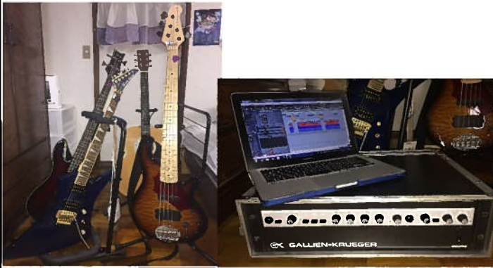
愛用している楽器

趣味はエレキベースです。何か趣味を始めようと思い、18歳で大学に入ってから始めました。音楽を聴くことが好きで、自分自身で演奏したいと思いました。ベースを選んだ理由は、バンドを支える重要なポジションで、カッコよいと感じたからです。また、音を聴いて、深みがあると感じたためです。1回10分以上の練習を週に4回以上行っております。バンドでは、ドラムと一緒にリズムを請け負う役割があります。他のメンバーの支えですが、他のパートとの掛け合いがあって面白いです。弾き方によって曲が変わってしまうので、考えながら弾いています。メンバーの入れ替わりがあり、ライブは開けていませんが、準備が整ったら是非会場に来ていただきたいです。