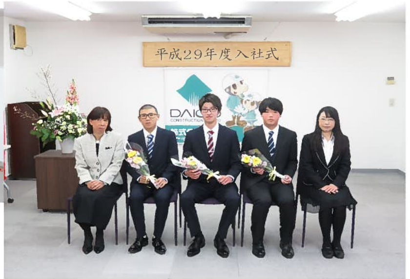
新入社員3名と親御さん