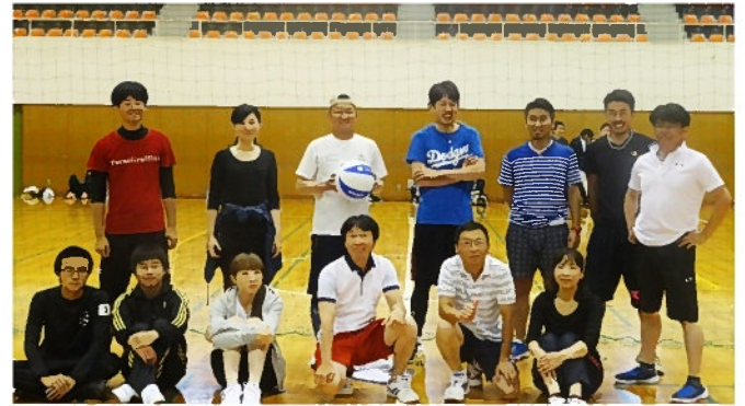
みんなで一丸となって準優勝に輝きました！