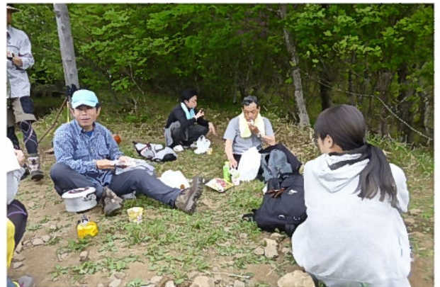
良い空気の中で食べるごはんは美味しいですね。

これからの季節は、登山に良い季節のようですね。ちなみに、これから見ごろの高山植物は、森の妖精と呼ばれる「レンゲショウマ」、高山植物の女王様と呼ばれる「コマクサ」だそうです。