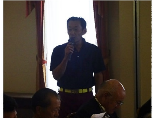
(柳田さん優勝スピーチ)