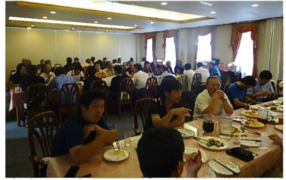
(コンペ後のパーティの様子)

今回は10月に行われる予定です。今回参加されなかった方も、是非ふるってご参加ください。