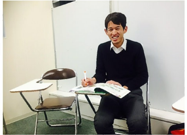
(英会話教室で勉強中の都丸係長)