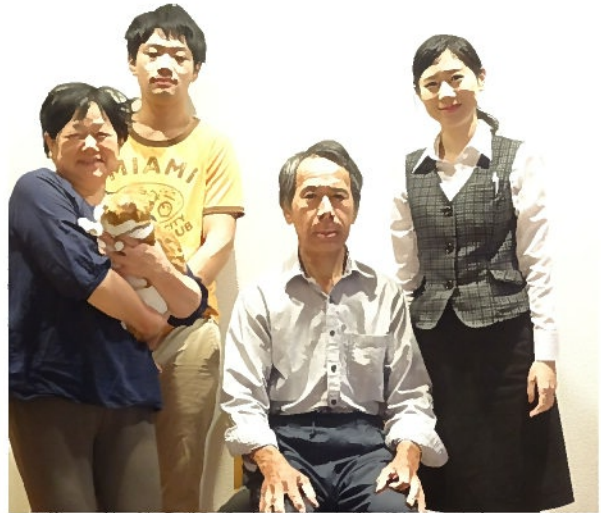
(左から訓子さん、尚弘さん、雅美さん、佳澄さん)

我が家では、先日会社に工事していただいたトイレが大好評で、家族みんなでリフォームっですごいね、と毎日感動しています。これからも、よろしくお願ひいたします。 (倉林)