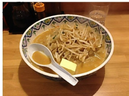
<味噌バターラーメン>